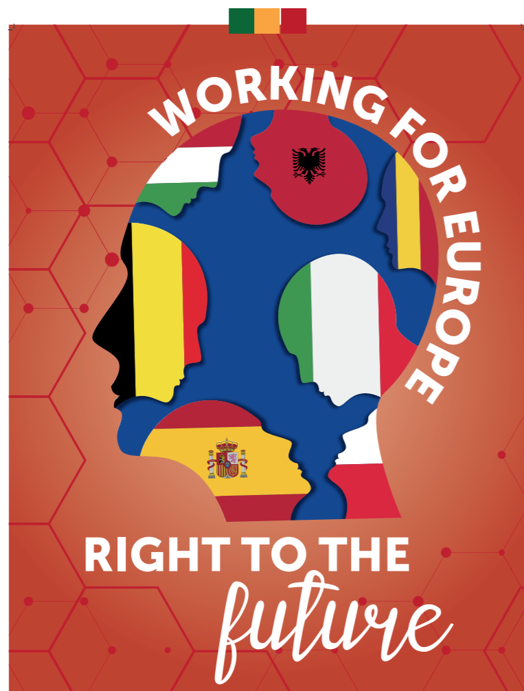
GIOVANI IDEE - INTERNATIONAL CONTEST 2016 - 2017